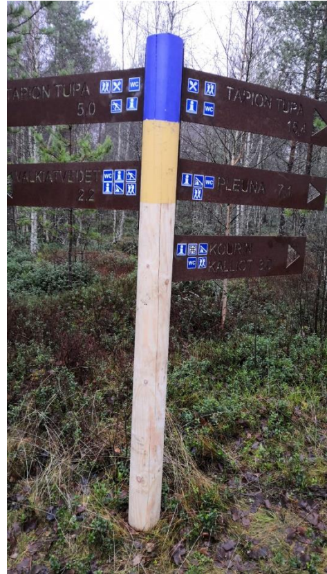
Kuva 2. Risteysopaste, uusittu