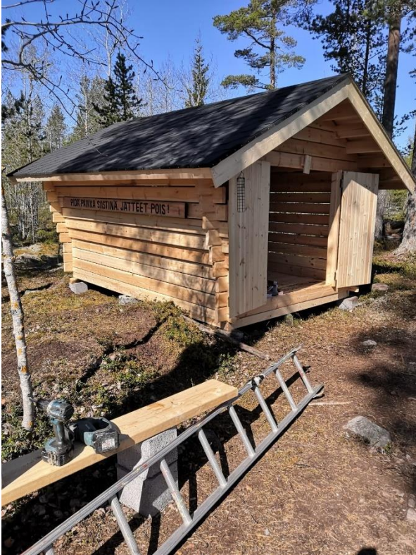
Kuvat 11. -12. Puuliiteri kourinkalliolla