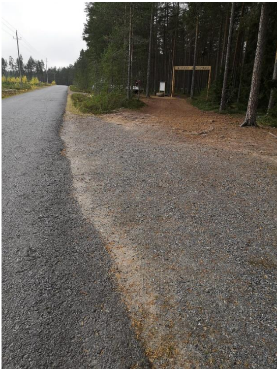
Kuva 3. Pleunan lähtöpiste