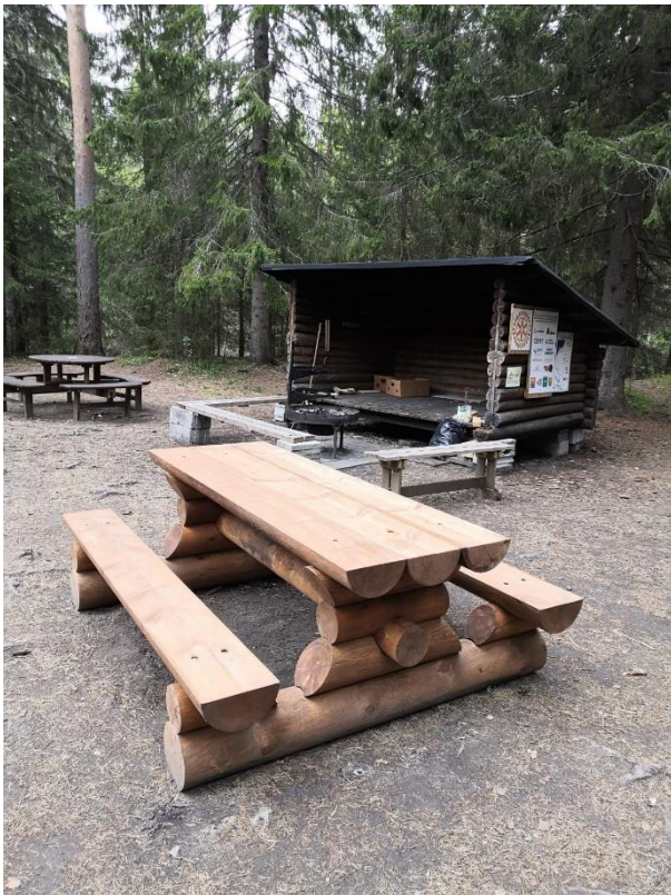
Kuva 7. Pleunan taukopaikka