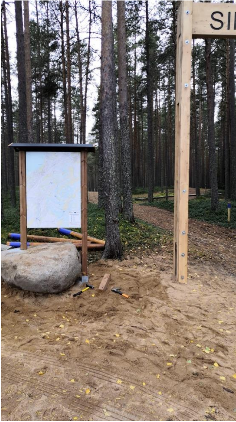
Kuva 5. Pleunan lähtöpiste infotauluineen