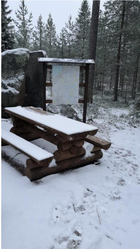
Kuva 1. Kourinkallion taukopaikka

Kuvia hankkeessa korjatuista ja rakennetuista kohteista