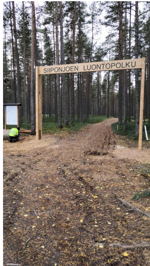
Kuva 6. Reitistön alkupiste reitistölle