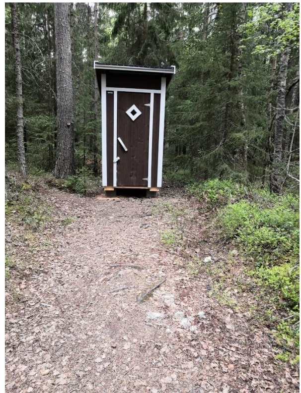
Kuva 8. Pleunan uusittu käymälä