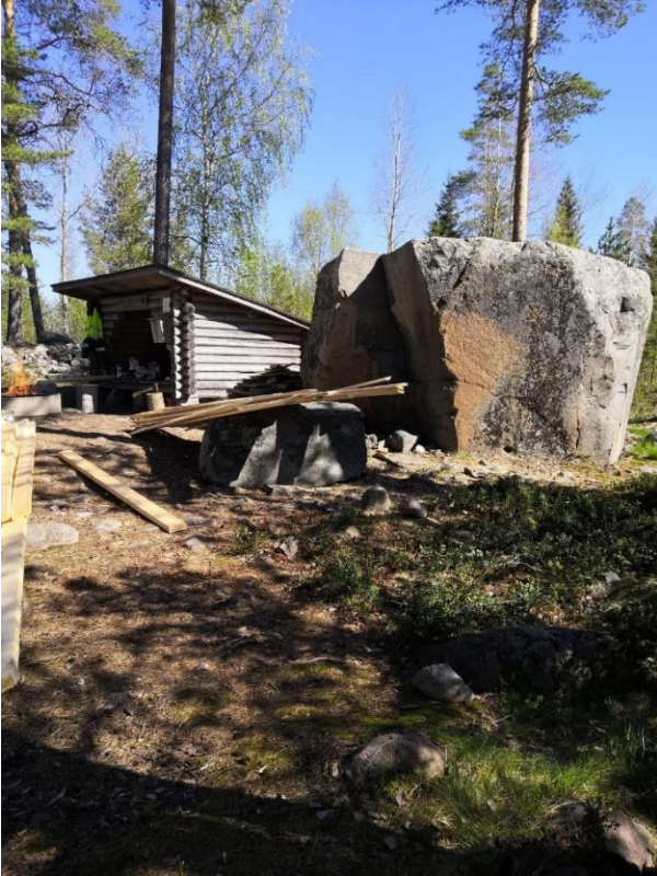
Kuva 9. Kourinkallion pitkospuiden uusimista