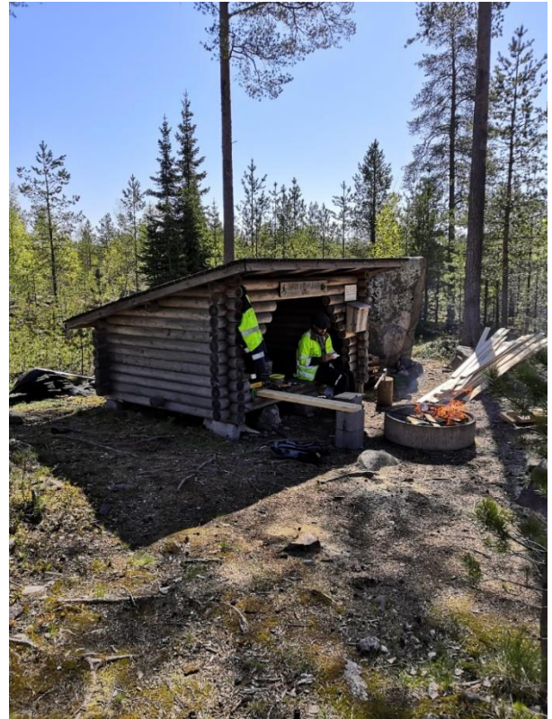
Kuva 10. Katon uusiminen käynnissä