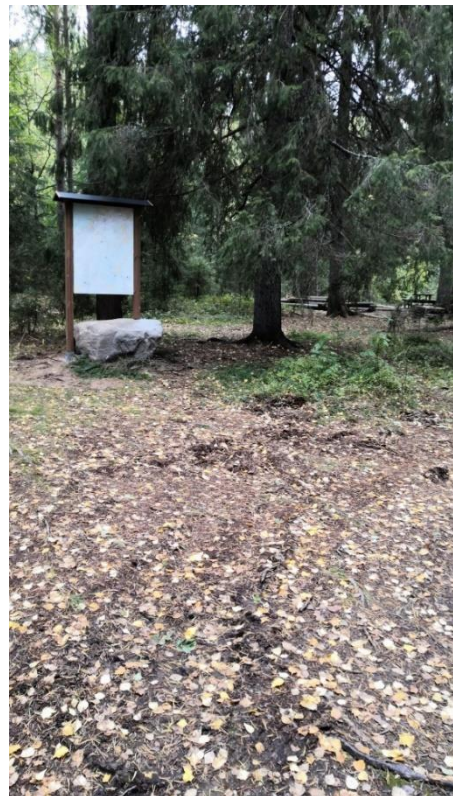
Kuva 4. Pleunan info-kartta