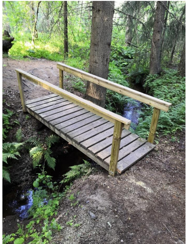
Kuat 13.-16. Pitkspuiden, portaiden ja siltarakenteiden uusimista reitistöllä