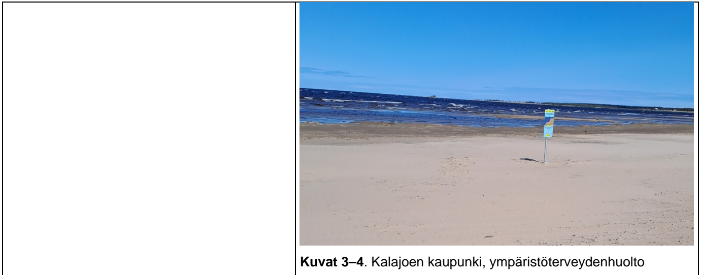
Kuvat 3–4. Kalajoen kaupunki, ympäristöterveydenhuolto