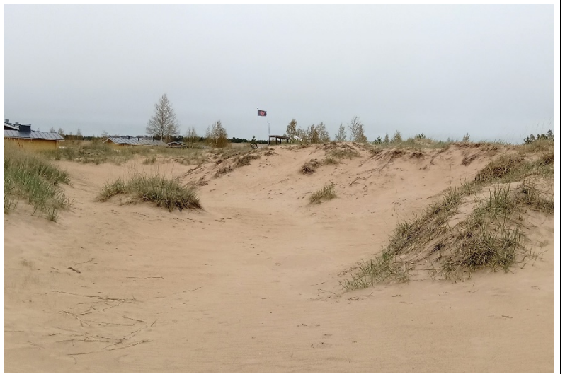
Kuvat 1 & 2. Kalajoen ympäristöterveydenhuolto