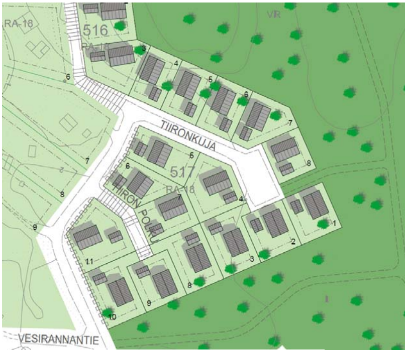
Kortteli 516 tontit 4-8 ja kortteli 517