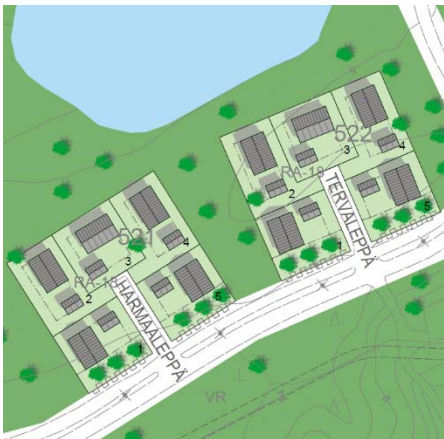
Korttelit 521 ja 522

Katto Kattomuodoksi suositellaan pulpettikattoa, murrettua harjakattoa tai harjakattoa. Katteen tulee olla tumma. Kortteleissa 527 ja 529 rakennus tulisi ensisijaisesti sijoittaa pääty katua kohti. Kortteliin ensimmäisenä rakentuva rakennus määrittelee kattomuodon muiden tonttien osalta.