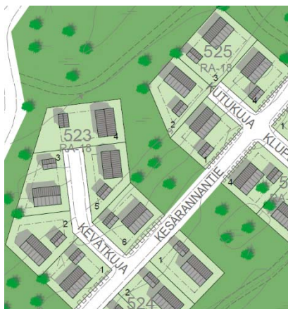
Korttelit 523 ja 525