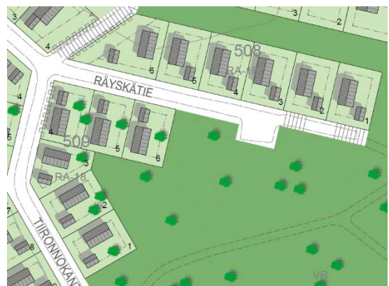
Korttelit 508 ja 509