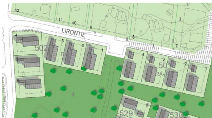
Korttelit 501 ja 502

Ympäristö Kortteleissa 508, 510, 511 ja 516 tulee kiinnittää erityistä huomiota olemassa olevaan puustoon. Tontilla oleva puusto tulee säilyttää muutoin kuin tontin rakennettavaksi tarkoitetulla osalla. Rakentaminen tulee toteuttaa varoen ja säästämällä luonnonympäristöä. Rakennettavaksi tarkoitetun osan ulkopuolelle jäävä puusto tulee ehdottomasti säilyttää ja hoitaa sitä niin, että liito-oravien liikkumisen kannalta riittävä määrä kulkuyhteyspuita säilytetään. Rakennuslupan yhteydessä on hakijan esitettävä suunnitelma rakennushankkeen soveltumisesta ympäristöön, sillä rakennuslupien ja puiden kaatamisen lupien ehtona on, ettei liito-oravalle soveltuvia elinympäristöjä heikennetä eikä hävitetä.