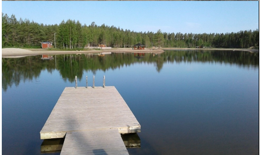
Kuvat. Jyrki Raatikainen