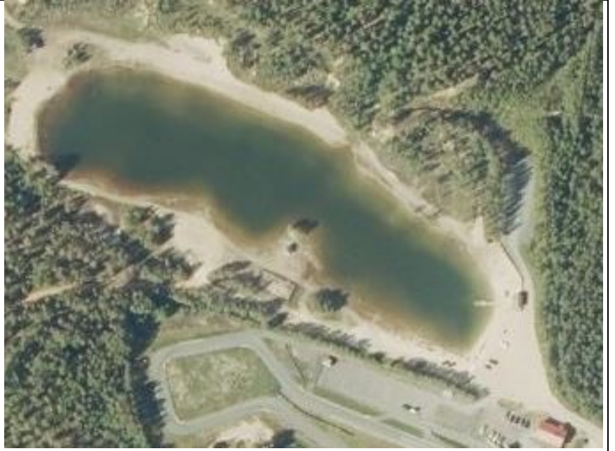
Kuva. Kalajoen kaupunki, ympäristöterveydenhuolto