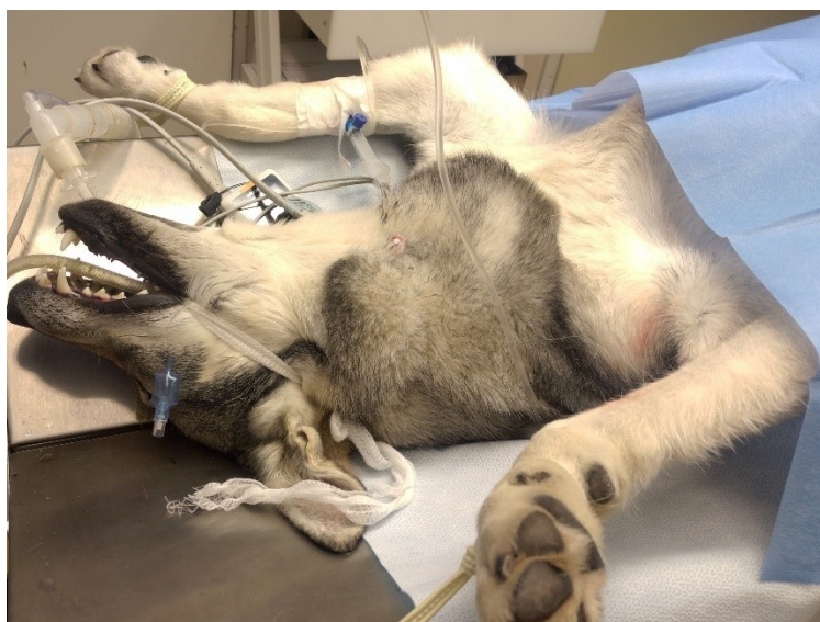
Vatsalaukun dilataation ja torson korjausleikkaus

Raahen Pieneläinklinikalla on toisinaan myös erillinen "silmäpäivä", jolloin silmäsairauksiin erikoistunut eläinlääkäri suorittaa virallisia silmätarkastuksia.