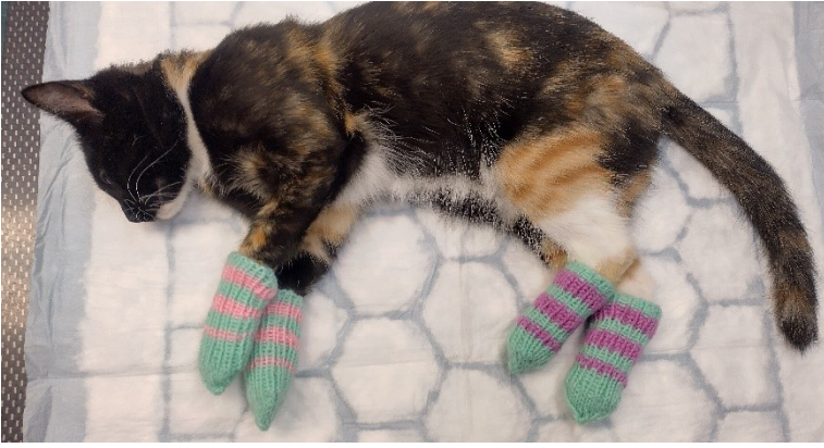
Sterilisaatioleikkaukseen tuleva kissa anestesiaasukissa