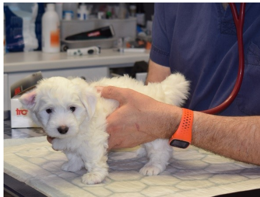
Koiranpentu eläinlääkäriin tarkastuksessa

Kummallakin vastaanotolla voidaan tehdä tavallisia eläinlääkinnällisiä toimenpiteitä, joita ovat esim. rokotukset, tunnistusmerkinnät, lemmikkieläinten passien kirjoitus, korva- ja silmätulehdusten hoito, kynsien leikkaus (tarvittaessa rauhoituksessa) jne.