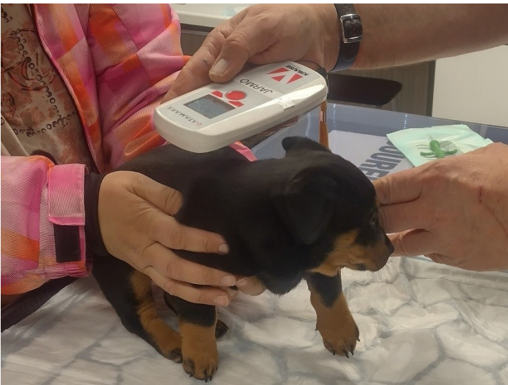
Koiranpennun mikrosirun tarkistus